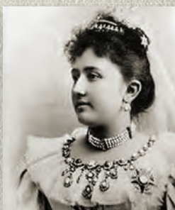
Принсес Хәдижә Габбас Хәлим