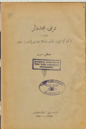
Шэйхелислам Мостафа Сабри һәм аның «Дини мөжәддидләр» исемле китабының гонваны