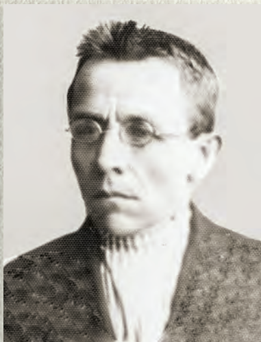
Муса эфенде инкыйлаблар дөвөрендэ