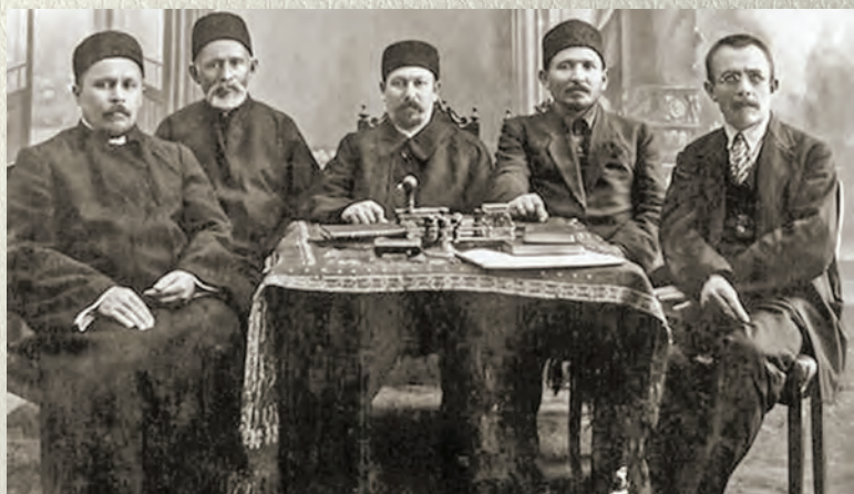
Мәккә мөселман корылтаеның Советлар Берлеге делегатлары белән. 1926