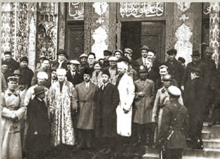
Әфганстан эмире Әманулла Хан белән Ленинград мәчетендә. 1928