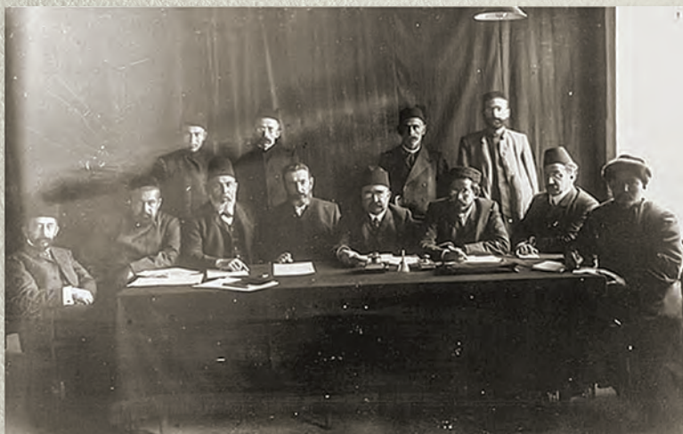
Муса әфәнде (икенче рәттә сулдан икенче) Русия мөселманнарынын 3 нче корылтае президиумында. 16 август, 1906