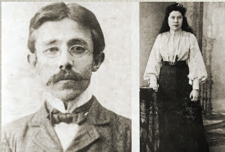
Муса әфәнде белән Әсма-Галия туташнын бер-берсенә жибәргән фотосурәтләре.