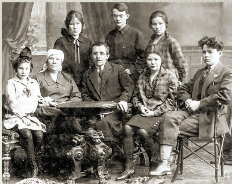
Гаиләсе белән. Ленинград, 1927