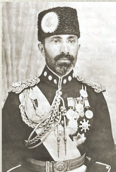
1929–1933 елларда хакимлек иткән Әфганстан патшасы Мөхəммəd Нəдир Шаһ