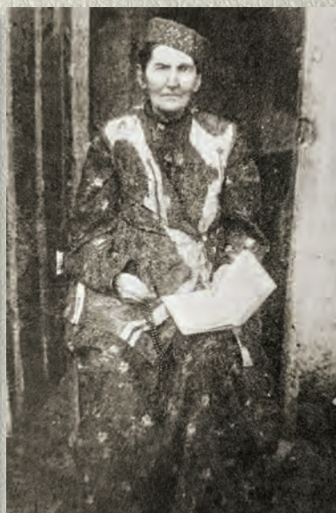
Муса әфәнденең әнисе Фатыйма ханым.