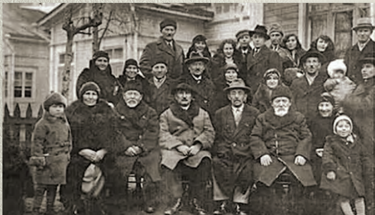
Финляндия татарлары белән. Муса әфәнде беренче рәттә уннан өчөнче. 1932–1933