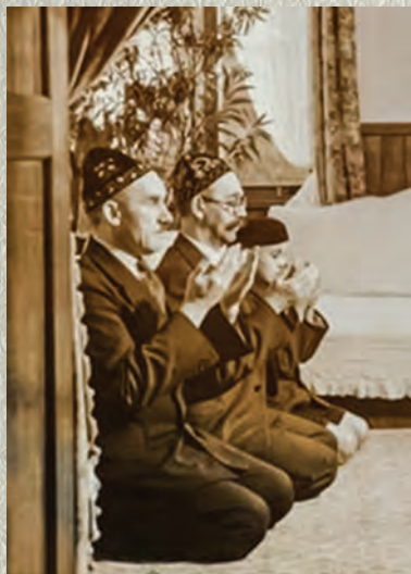
Токио, 1938–1939.