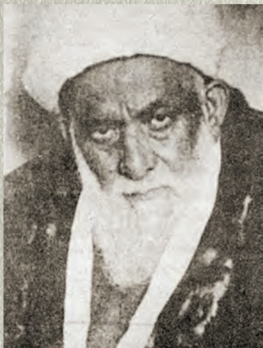
Муса эфенденен китап- рын ясаклаган шэйхелислам Мөхөммөт Эсад эфенде