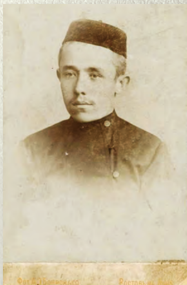
Муса Бигиев. 1893