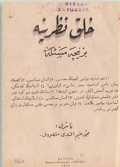
«Халык назарына берничә мәсьәлә» китабы. 1912