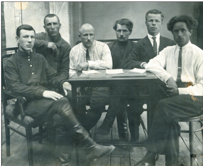
Красногвардейцы Алафузовской фабрики. 1918 г. (ИМ РТ. КППи-120224)