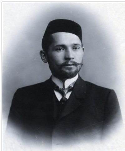
Хасанов Калимулла Гумерович (1878–1949) – помощник казанско- го губернского комиссара, депутат Государственной Думы II созыва