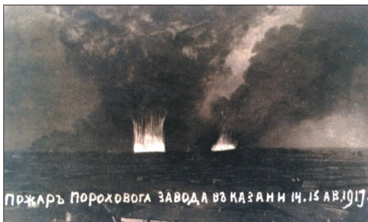
«Казанская катастрофа» – пожар на Пороховом заводе 14–15 августа 1917 г.