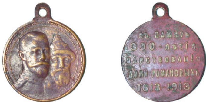
Юбилейная медаль «300-летие правления дома Романовых». 1913 г.