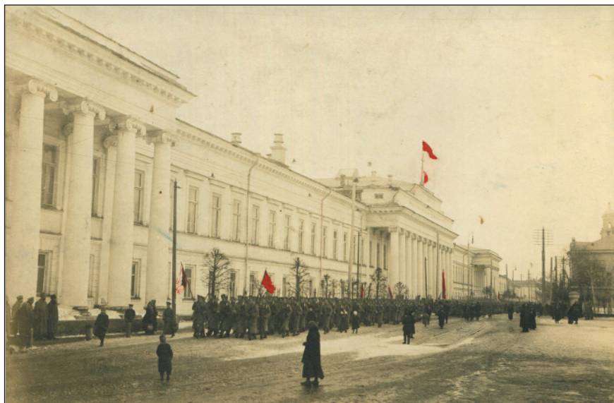
Колонна революционных солдат в дни февральской революции 1917 г. у здания Казанского университета.