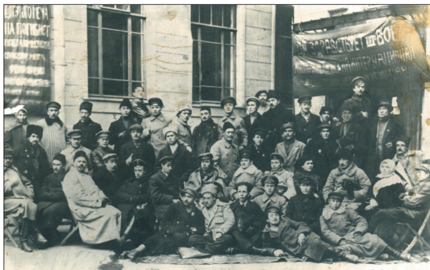
Участники первого съезда коммунистов-мусульман. Казань, 1918 г.