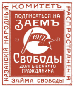
Агитационная марка. 1917 г.