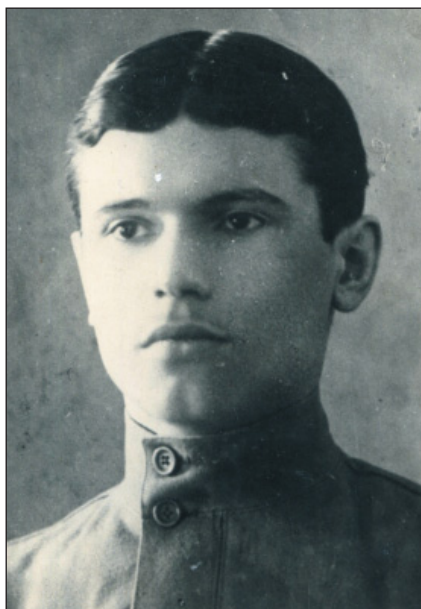
Маликов Ади Каримович (1897–1973) – комиссар Петро- градского мусульманского полка (1917), заместитель председателя Тетюшского уездного совета (ноябрь 1917 – февраль 1918), военный раз- ведчик ( ИМ РТ. В-16554 )