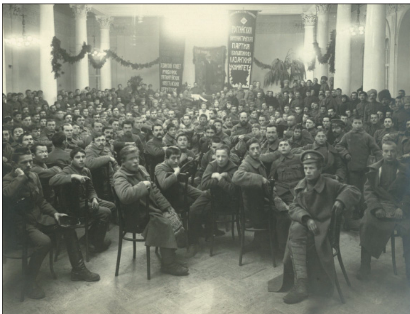
Из фотоальбома с фотографиями событий первой годовщины Октябрьской революции в Казани. 1918 г. (ИМ РТ. КППи-101685 ст. № 15561)