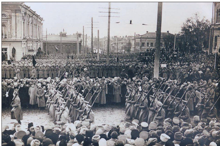
Парад новобранцев Белой армии. Казань, 1918 г.