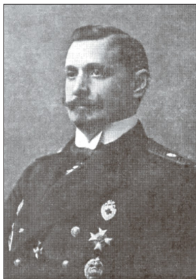
Боярский Петр Михайлович (1870–1944) – последний Казанский губернатор