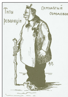
Почтовая открытка из серии «Типы революции». 1917 г. (из частной коллекции)