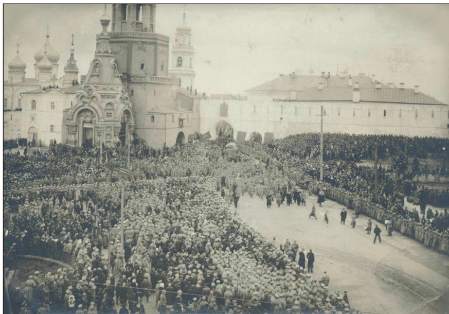
Празднование Февральской революции на Ивановской площади в Казани. 1917 г. (НМ РТ. КППи-115955)