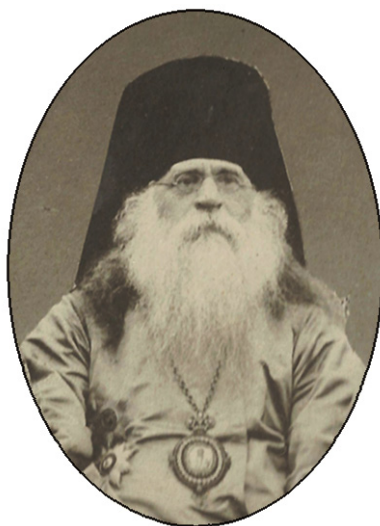
Архиепископ Иаков (Пятницкий) Казанский и Свияжский. Казань, 1914 г.