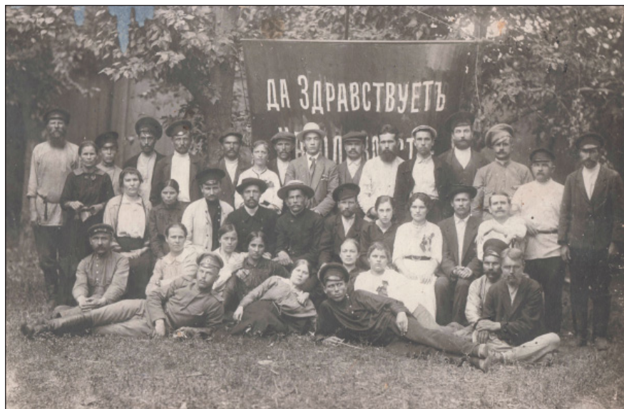
Фабрично-заводской комитет Алафузовских фабрик и заводов. 1917 г. (ИМ РТ. В-11580)