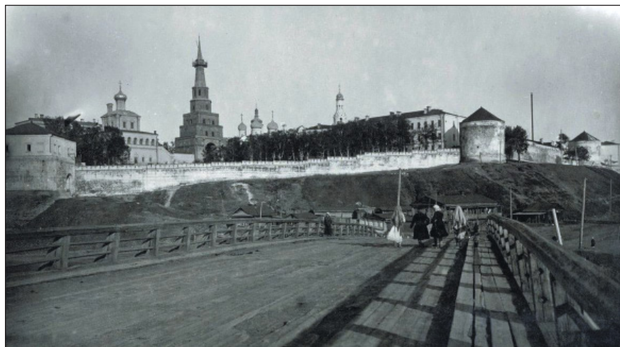
Башня Сююмбике Казанского кремля без двуглавого орла. 1918 г. ( pastvu.com )