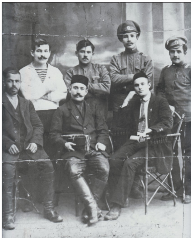
Группа членов мусульманского военного бюро, снявших царский герб с башни Сююмбике. Сентябрь, 1917 г. (ИМ РТ. КППи- 119790)