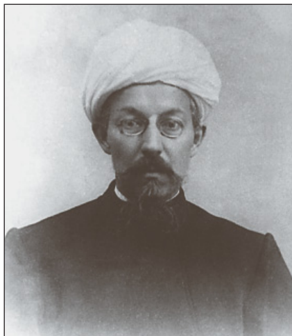
Галимджан Баруди (1857–1921) – казанский мулла, первый избранный муфтий России