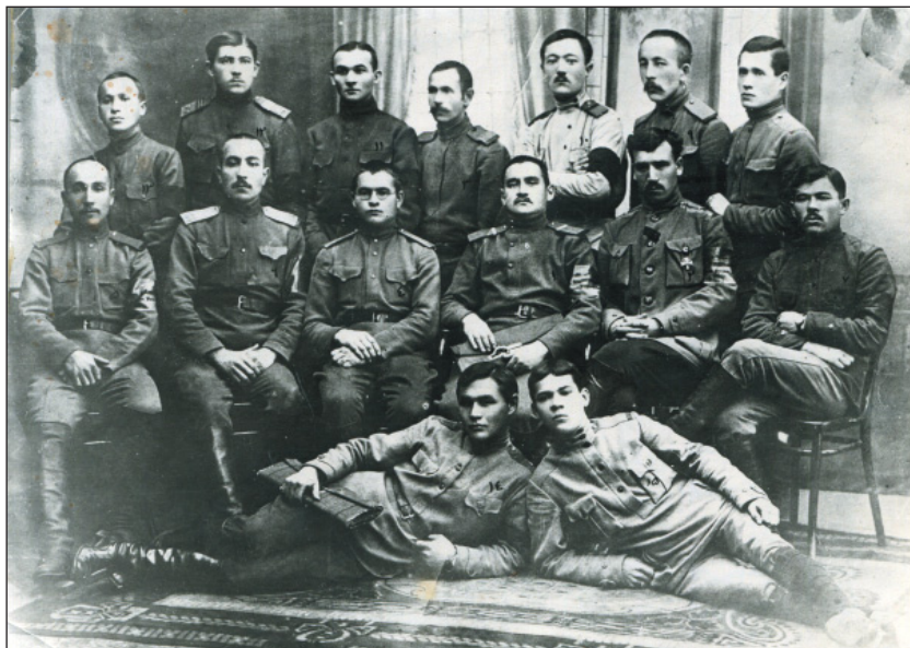
Татарская секция Гарнизонного комитета Казани. 1917 г. (НМ РТ. КППи-119766/6)