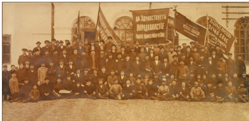
Рабочие механического отдела Алафузовских фабрик и заводов в Казани. 1 мая 1917 г.