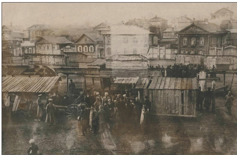
Обстрел Казанского кремля красновардейцами Заречья. 25.10.1917 г.