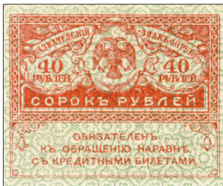
«Керенка» – денежный знак 1917–1918 гг.