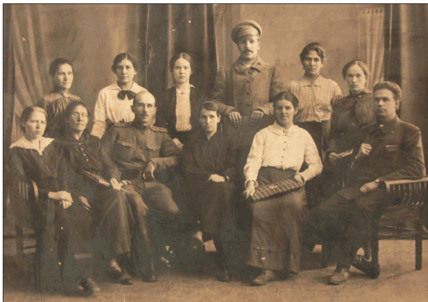
Правление Союза солдаток г. Казани. Апрель, 1917 г. (ИМ РТ. КППи-119870)