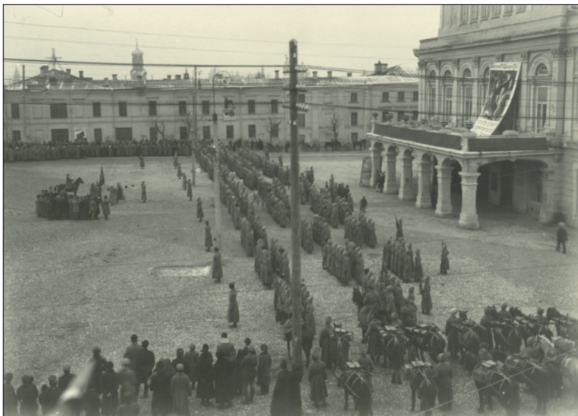
Из фотоальбома с фотографиями событий первой годовщины Октябрьской революции в Казани. 1918 г. (НМ РТ. КППи-101685 ст. № 15561)