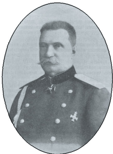
Санецкий Александр Генрихович (1851–1918) – генерал от инфан- терии, командующий Казанским военным округом