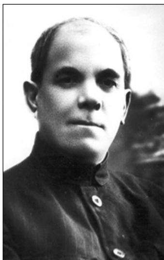
Ханафи Терегулов (1877–1942) ( http://www.millattashlar.ru/index.php/Терегулов_Ханафи_Гасанович )