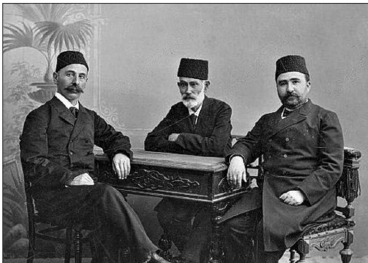
Исмаил Гаспринский, Гасан-бек Зардаби и Алимардан-бек Топчибашев. Баку, 1907 г. ( https://ru.wikipedia.org/wiki/Топчибашев,_Алимардан-бек )