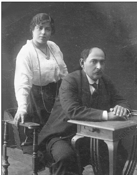
Нариман и Гюльсум Наримановы. 1915 г. ( https://ru.wikipedia.org/wiki/Нариманов,_Нариман_Кербалаи_Наджаф_оглы )