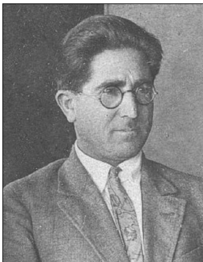
Вели Хулуфлу ( https://ru.wikipedia.org/wiki/Хулуфлу,_Вели_Магомед_Гусейн_оглы )