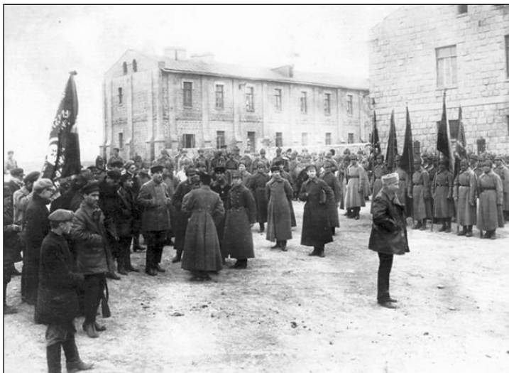
Красная армия в Баку. Май 1920 г.