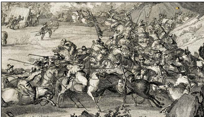
Рис. 10. Ойраты Даваци сражаются против ойратов Аюши в битве у горы Гэдэн-ола в 1755 г. Фрагмент гравюры И.С. Эльма (1784 г.) с рисунка Дж. Кастильоне (1764–1765 гг.).

После сражения, джунгарские аристократы один за другим стали присягать цинскому императору, но лишь для того, чтобы через несколько месяцев вновь поднять знамя вооруженной борьбы против Пекина. Это восстание раскололо ойратскую элиту. Многие нойоны предпочли сохранить лояльность империи в то время, как другие вступили в ожесточенную борьбу как с цинскими войсками, так и с амбициозными сородичами пытающимися воссесть на призрачный престол правителя уже несуществующей державы.