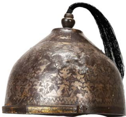
Рис. 6. Джунгарский цельнокованный шлем с «коробчатым» козырьком, вторая половина XVII – середина XVIII вв., Национальный музей Республики Казахстан, г. Астана, Республика Казахстан [по: Бобров, Агатай, Хасенов, 2024].

Боевые наголовья джунгар были представлены шлемами (рис. 6), мисюрками и кольчужными «башлыками» (рис. 5). Первоначально у ойратов тотально доминировали клёпаные шлемы с полусферической, сфероконической или сфероцилиндрической тульей. Однако в первой половине XVIII в. всё большую популярность стали набирать цельнокованные наголовья (рис. 6), часть которых, вероятно, была выкована мусульманскими мастерами на джунгарской службе 22 . Все виды шлемов могли дополняться козырьками и бармицами различных типов. Кроме того, цинские авторы середины XVIII в. упоминают на вооружении джунгар наголовья, снабжённые дополнительной защитой лица «из тонкого железа... из-под которой едва видны оба глаза» 23 .