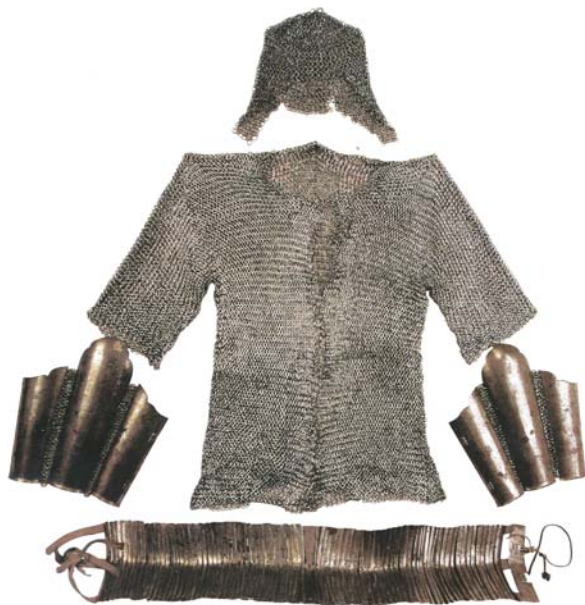
Рис. 5. Кольчужный «башлык», кольчатый панцирь, створчатые наручи и пластинчатый пояс- бельдемчи (предположительно из числа трофеев, захваченных цинскими войсками в 50-х гг. XVIII в.). Происходит из собрания вана хошуна Дөрвөн Хүүхэд (Сыцзы), Уланчаб, АР Внутренняя Монголия КНР.

фицированной конструкции в виде распашного жилета 20 . На протяжении всего периода существования Джунгарии большой популярностью пользовались различные типы стёганных панцирей- олбог , подбитых хлопком и, возможно, шёлковой ватой 21 . В качестве защиты рук применялись пластинчатые нарукавья ( харабчи , харабч ) и створчатые наручи (рис. 5).