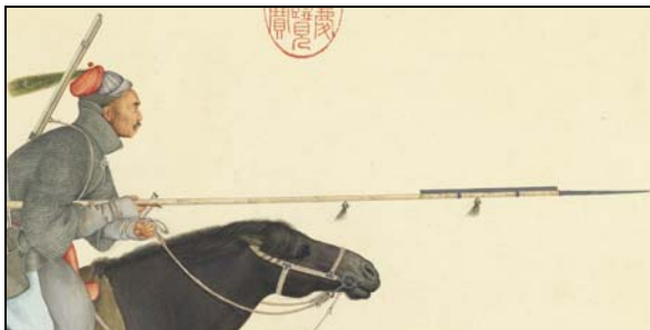
Рис. 1. Фрагмент портрета Аюши – ойратского военачальника на цинской службе, вооружённого пикой-джид(а) с «отрезом» и кистями.

Характерным элементом оформления джунгарских пик были небольшие парные (реже одинарные или тройные) кисточки, подвешенные к верхней части древка (рис. 1; 2). Тюркские воины украшали свои копьё медными кольцами. Самые бедные ополченцы использовали цельнодеревянные пики, заточенные и обожжённые на конце 11 .