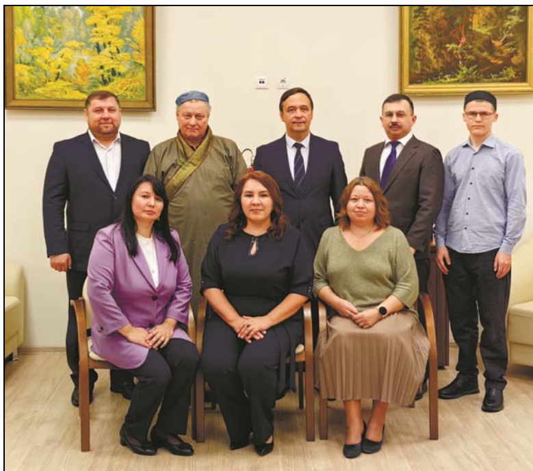
Фоторепортаж расширенного заседания редколлегии, посвященного 10-летию основания журнала «Золотоордынское обозрение». 31 октября 2023 г.