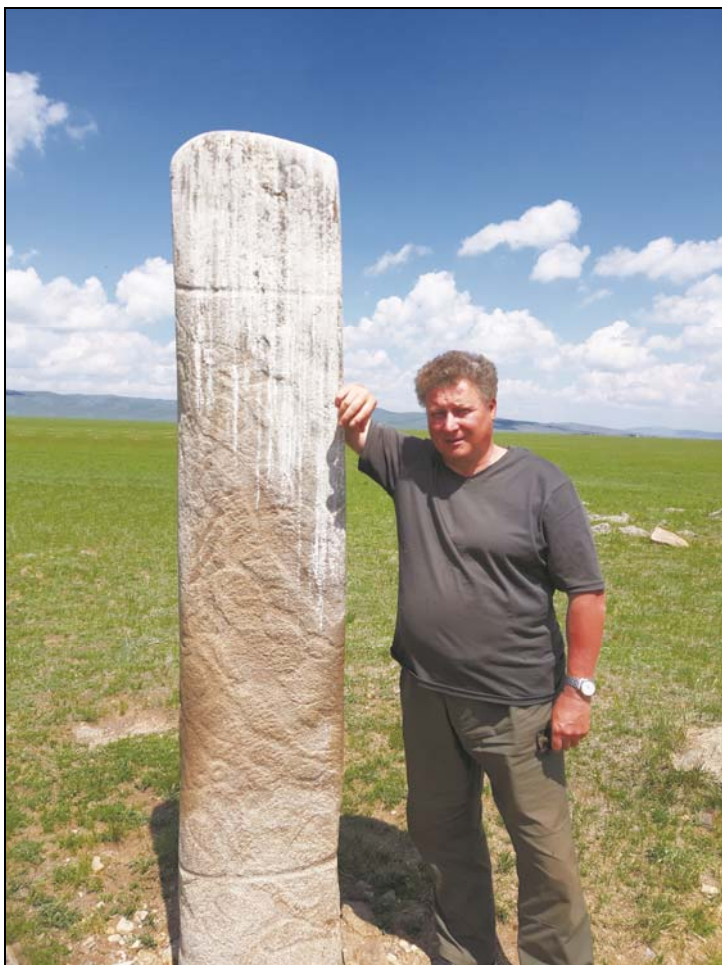
У оленного камня. Северная Монголия. 2019 г.