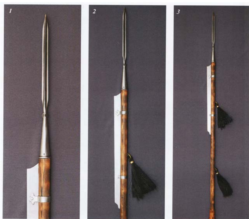
Рис. 2. Джунгарская пика-джид(а) с «отрезом» и кистями. Реконструкция по материалам вещественных и изобразительных источников. Авторы реконструкции: Л.А. Бобров, Ю.А. Филиппович (мастер).

Джунгарские копейщики достигли высокого уровня мастерства во владении длиннодревковым оружием. Они практиковали не только традиционный для Центральной Азии тычковый удар копьём, наносимый двумя руками, но и различные приёмы фехтования древком, а также местный вариант «таранного» удара, когда копьё жёстко зажималось и фиксировалось подмышкой 12 .