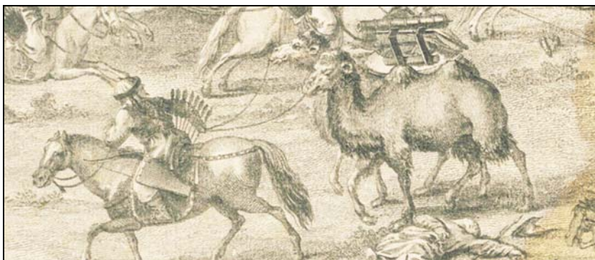
Рис. 9. Цинский всадник ведёт в поводу верблюда с трофейной пушкой в ясельном седле. Фрагмент гравюры, изображающей сражение у р. Аличур в 1759 г., офорт И.С. Эльма (1785 г.) с рисунка Ж.-Д. Аттире (ок. 1763 г.).

Создание собственного артиллерийского производства в Джунгарии является уникальным для Центральной Азии примером адаптации кочевого этноса к стремительно меняющимся военно-политическим условиям эпохи «Пороховой революции». Необходимо подчеркнуть, что все основные противники Джунгарии в кочевом мире – казахи, киргизы, каракалпаки, халха-монголы – не только не создали собственного пушечного производства, но и вообще не обладали сколько-нибудь значительным артиллерийским парком 40 .