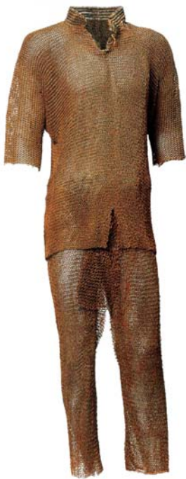
Рис. 4. Джунгарская или восточнотуркестанская кольчуга со стоячим воротником и кольчужными «штанами», первая половина – середина XVIII в. Захвачены цинскими войсками в 1759 г. Собрание музеев Гугун, г. Пекин, КНР.

панцирь дополнялся кольчужными «штанами» или набедренниками (рис. 4). Другой разновидностью покроя кольчатого корпусного доспеха был безрукавный жилет с боковым разрезом, который можно было носить поверх стеганого халата или даже не слишком толстого «мягкого» панциря из органических материалов 18 .