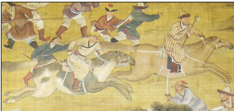
Рис. 3. Ойратские воины с саблями и мусульмане с топорами. Фрагмент картины «Великая победа при Курмане [в 1759 г.]» для павильона «Цзыгуангэ», коллективный труд европейских и цинских придворных художников, ок. 1760 г., Гамбургский музей этнологии, г. Гамбург, ФРГ.

В ближнем бою воины Джунгарского государства применяли слабоизогнутые сабли или палаши с гардой в виде перекрестья ( илд ), мечи ( шор ), тяжёлые тесаки с изогнутым или прямым клинком- сэлэм . Среди мусульман Восточного Туркестана, наряду с тесаками, популярностью пользовались сильноизогнутые сабли (вероятно, шамширы и их среднеазиатские дериваты), а также обоюдоострые кинжалы ( ханджар ). Численно преобладали слабоизогнутые сабли и палаши с относительно коротким клинком. Тюркские воины охотно использовали в бою боевые топоры и секиры- айбалта на длинных кавалерийских топорищах (рис. 3). Отдельные образцы ударно-рубящего оружия могли дополнительно снабжаться копьевидным наконечником, металлической рукоятью и шипами на обухе. Среди этнических ойратов боевые топоры имели ограниченное распространение 13 .