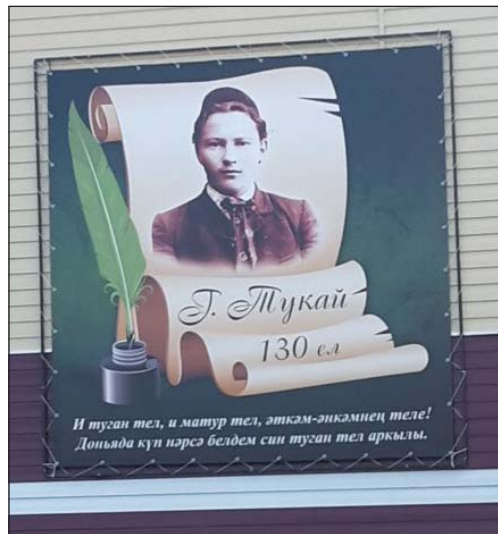
Рис. 17. Плакат на татарском языке с текстом стихотворения Г.Тукая, г.Буинск