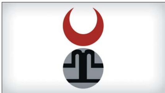
Рис. 3. Фото со стены в группе «Татары и татарочки» от 2 апреля 2014 г. «Алтын Урда байрагы / Флаг Золотой Орды». – URL: https://vk.com/wall-1777_281744 (дата обращения: 1.09.2016)