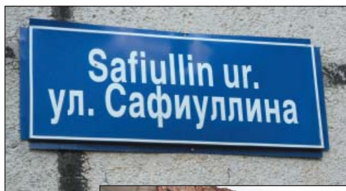
Рис. 27. Табличка с названием улицы с использованием латинской графики, г.Казань