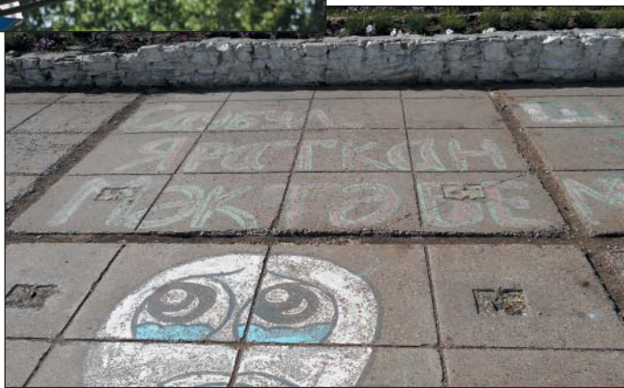
Рис. 16. Граффити на школьном дворе на татарском языке, г.Н.Челны