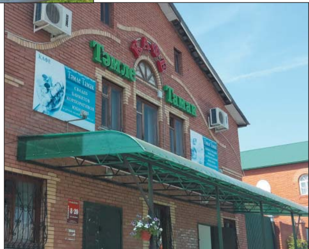
Рис. 32. Главная надпись на здании торгового центра, г.Буинск