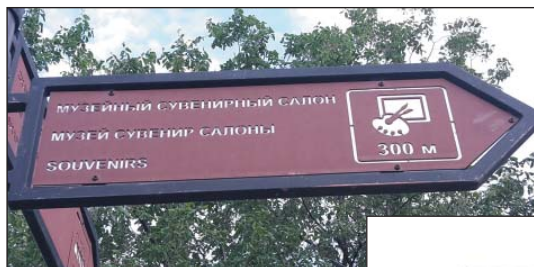
Рис. 10. Надпись на дорожном указателе на трех языках, г.Чистополь