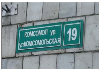
Рис. 5. Варианты табличек с названием улицы, г.Зеленодольск