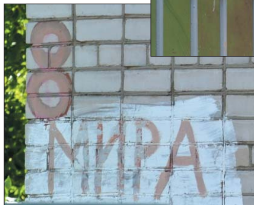
Рис. 25. Старая надпись, сделанная краской на фасаде дома только на русском языке, г.Казань