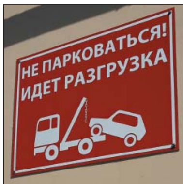
Рис. 39. Предупреждающий вариант таблички коммерческого учреждения только на русском языке, г.Зеленодольск