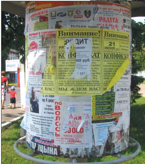
Рис. 30. Доска объявлений, сделанных только на русском языке, г.Зеленодольск