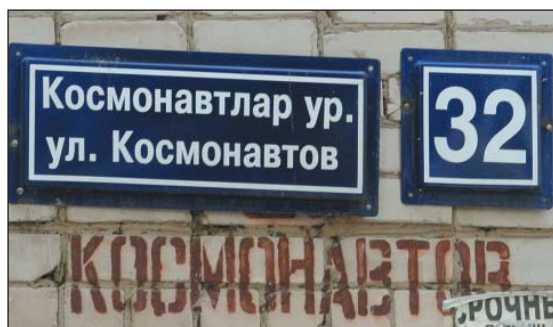
Рис. 24. Старая надпись, сделанная краской на фасаде дома только на русском языке, и новая табличка с использованием двух государственных языков РТ, г.Казань