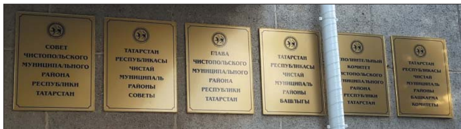
Рис. 41. Официальные таблички с паритетным использованием двух государственных языков РТ, г.Чистополь