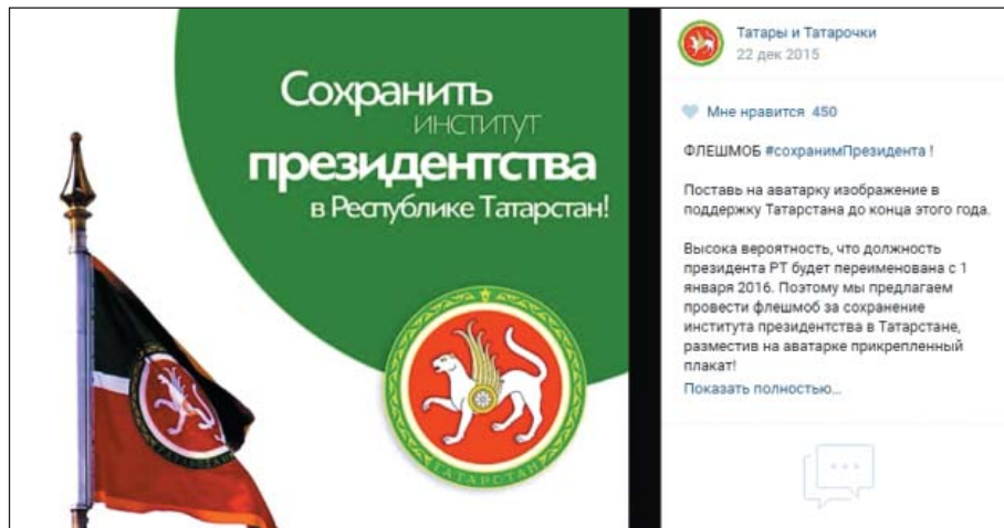
Рис. 1. Фото со стены в группе «Татары и татарочки» от 22 декабря 2015 г. – URL: https://vk.com/wall-1777_519842 (дата обращения: 5.09.2016)