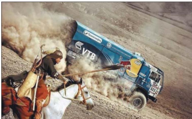
Рис. 4. Фото со стены в группе «Татары и татарочки» от 3 ноября 2015 г. «Киләчәккә горур атлап барыр өчен, үз халкыңның тарихын һәм үткәннәрен онытма!». – URL: https://vk.com/wall-1777_499854 (дата обращения: 1.09.2016)