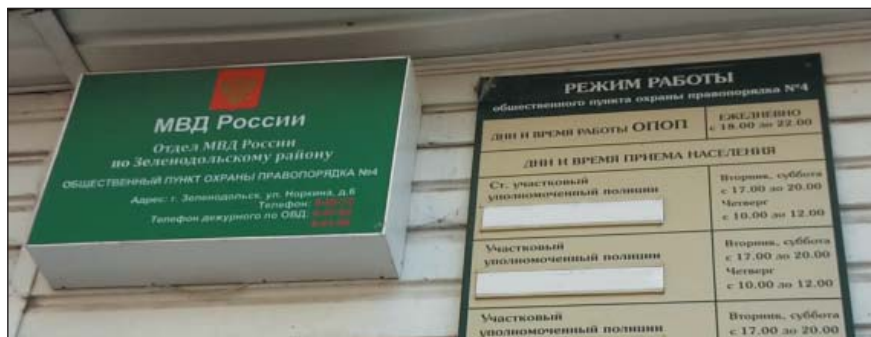
Рис. 23. Вывеска Отдела МВД России по Зеленодольскому району и режим работы только на русском языке, г.Зеленодольск