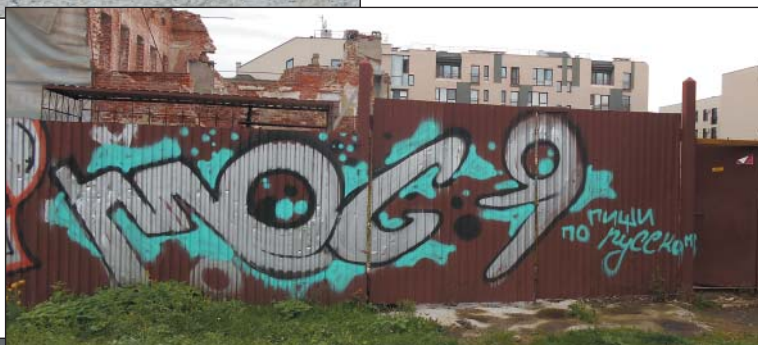
Рис. 29. Граффити, призывающее писать на русском языке, г.Казань