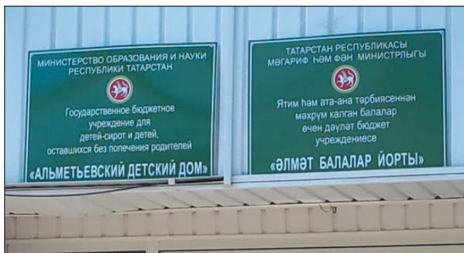
Рис. 21. Вывеска образовательного учреждения на двух государственных языках РТ, г.Альметьевск