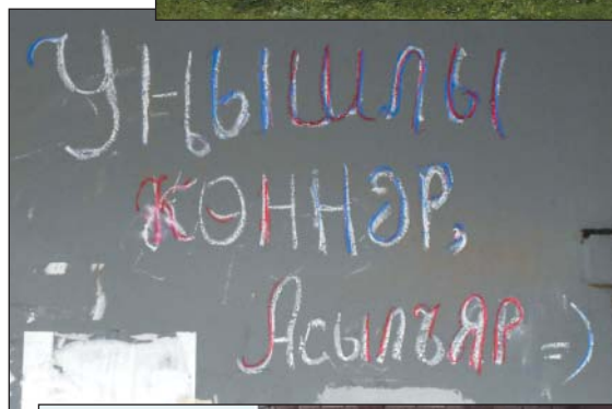
Рис. 28. Использование татарского языка в граффити, г.Казань