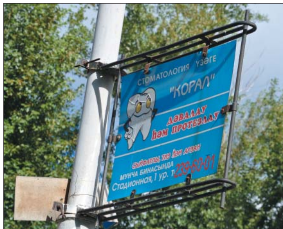
Рис. 15. Реклама стоматологической поликлиники только на татарском языке, г.Казань