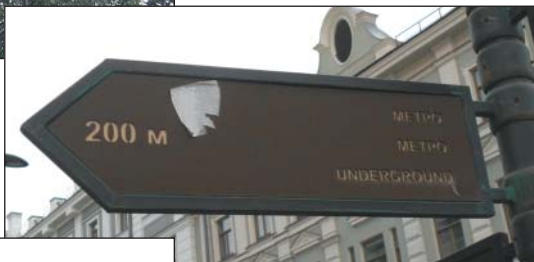
Рис. 11. Надпись на дорожном указателе на трех языках, г.Казань