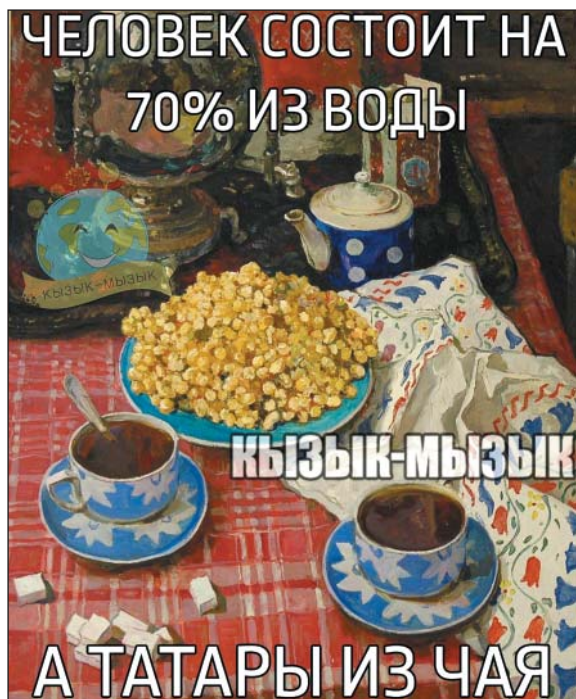
Рис. 6. Фото со стены в группе «КЫЗЫК-МЫЗЫК (Татарча юмор) | Татарстан | Казань» от 15 июля 2016 г. – URL: https://vk.com/wall-27570998_132030 (дата обращения: 1.09.2016)