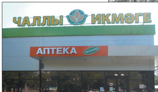
Рис. 12. Вывеска на продуктовом магазине, г.Н.Челны