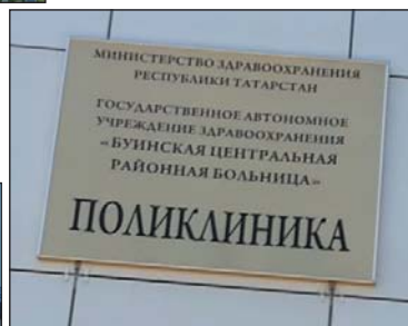
Рис. 20. Главная надпись только на русском языке и вывеска учреждения здравоохранения на двух государственных языках РТ, г.Буйнск