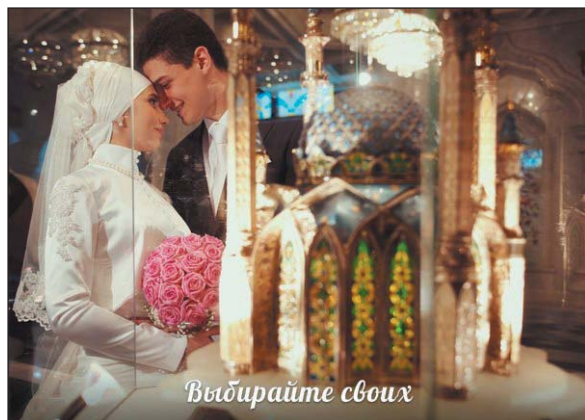
Рис. 5. Фото со стены в группе «Татары и татарочки» от 5 ноября 2013 г. – URL: https://vk.com/wall-1777_182888 (дата обращения: 5.09.2016)