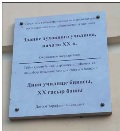
Рис. 8. Памятная табличка на двух государственных языках РТ, г.Чистополь