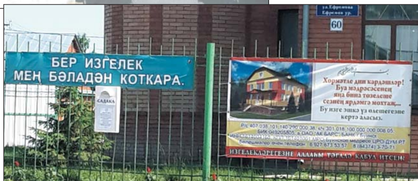
Рис. 31. Плакаты на территории мечети только на татарском языке, г.Буинск