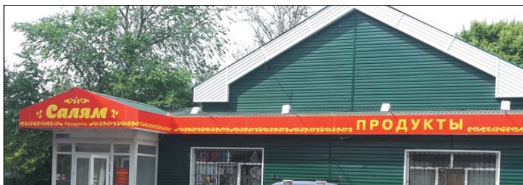
Рис. 13. Главная вывеска на продуктовом магазине, г.Альметьевск