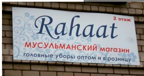
Рис. 34. Вывеска с названием коммерческого учреждения только на русском языке, но с частичным использованием латинской графики, г.Н.Челны