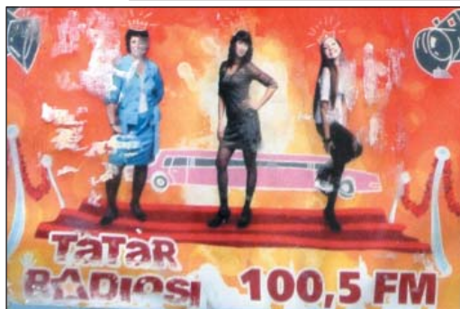
Рис. 14. Рекламный пост «Tatar radiosi» только на татарском языке, г.Казань