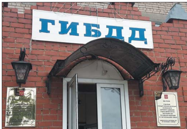
Рис. 22. Главная надпись на здании ГИБДД на русском языке, информация об учреждении на двух государственных языках РТ, г.Чистополь