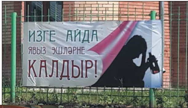
Рис. 31. Продолжение