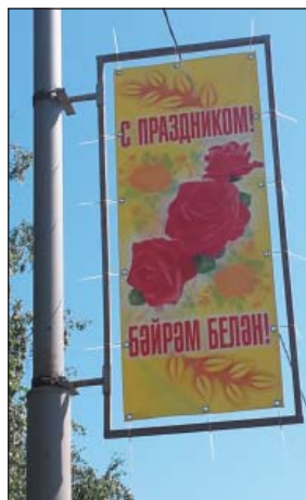
Рис. 7. Растяжка ЖКХ на двух государственных языках РТ, г.Чистополь