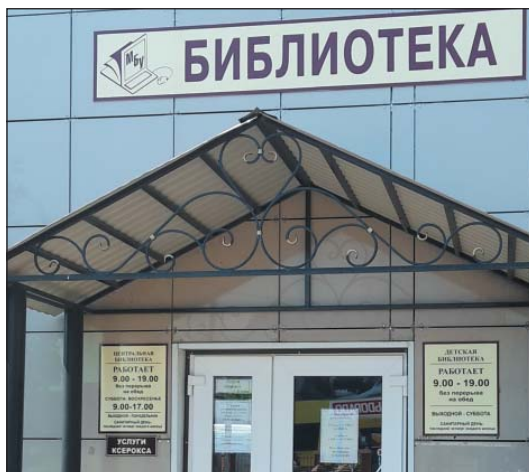
Рис. 18. Главная надпись на здании библиотеки и информация об учреждении и режиме работы на русском языке, г.Нурлат