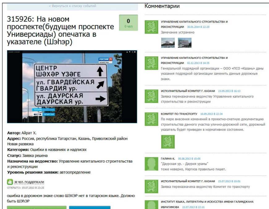
Рис. 2. Скриншот страницы государственной информационной системы «Народный контроль». – URL: https://uslugi.tatarstan.ru/open-gov/detail/315926 (дата обращения: 24.11.2015)