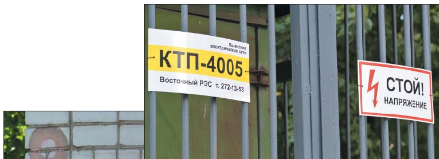
Рис. 26. Предупреждающие таблички только на русском языке, г.Казань