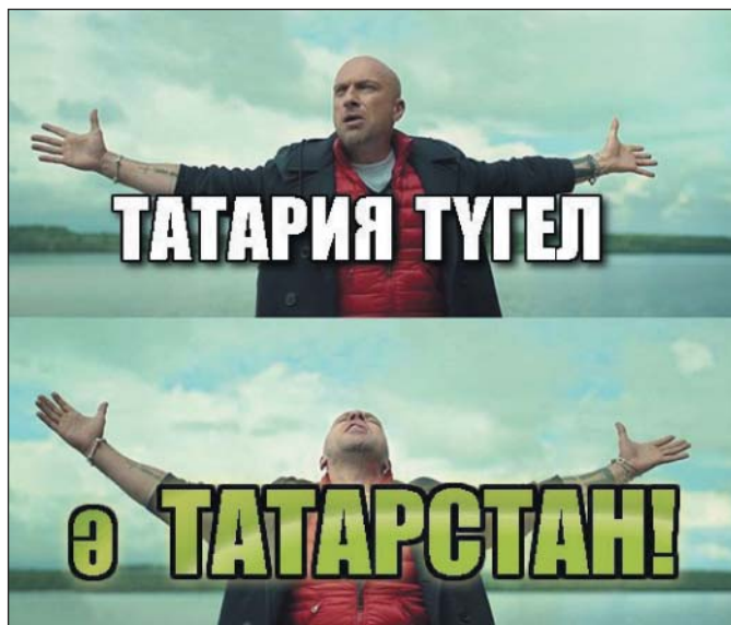
Рис. 2. Фото со стены в группе «Татары и татарочки» от 22 августа 2016 г. – URL: https://vk.com/wall-1777_604244?reply=604284 (дата обращения: 5.09.2016)