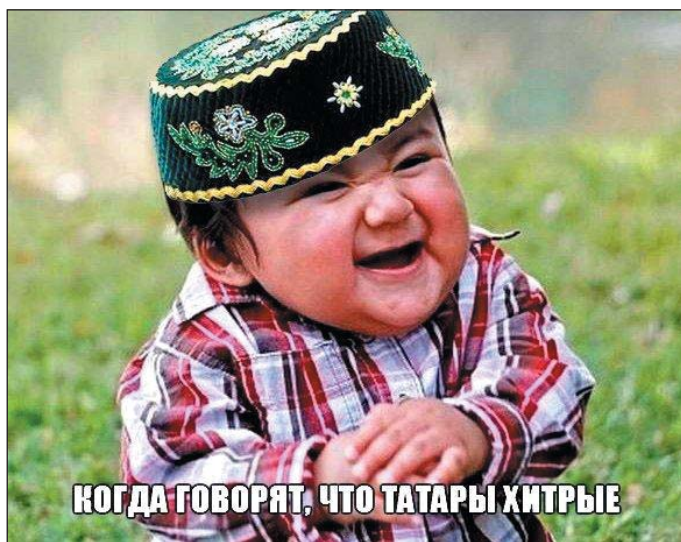
Рис. 7. Фото со стены в группе «КЫЗЫК-МЫЗЫК (Татарча юмор) | Татарстан | Казань» от 15 мая 2016 г. – URL: https://vk.com/wall-27570998_118100 (дата обращения: 1.09.2016)