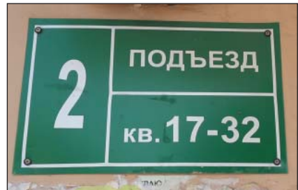
Рис. 38. Наиболее часто встречающийся тип таблички ЖКХ только на русском языке, г.Зеленодольск